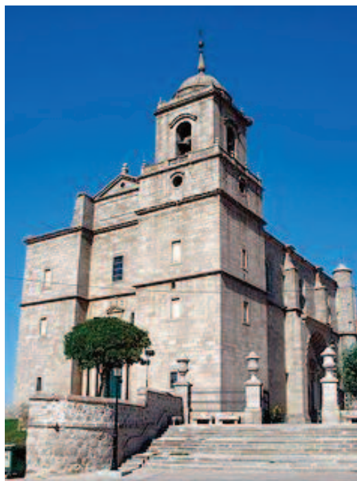
La Catedral de la Sierra